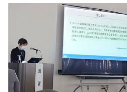
JSSCR総会 演題発表の様子 2025/2