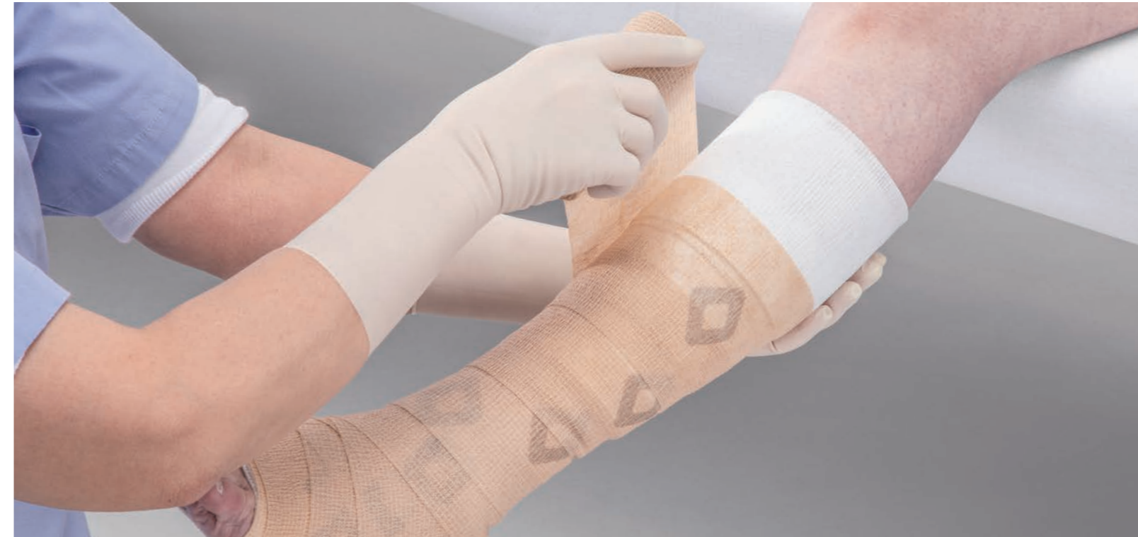
デュアプレス・テンションガイド Dualpress-Tension Guide